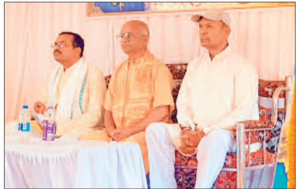
डौण्डी