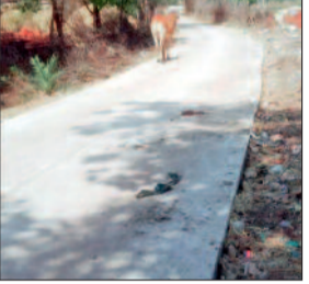
हरिभूमि न्यूज | बालोद