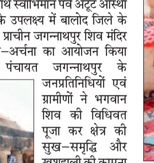
हरिभूमि न्यूज | बालोद

बालोद। सोमनाथ स्वामिमान पर्व अटूट आस्था के 1100 वर्ष के उपलक्ष्य में बालोद जिले के ऐतिहासिक एवं प्राचीन जगन्नाथपुर शिव मंदिर में विशेष पूजा-अर्चना का आयोजन किया गया। ग्राम पंचायत जगन्नाथपुर के