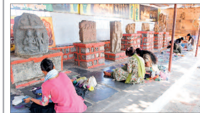
हरिभूमि न्यूज | बालोद

जिला मुख्यालय बालोद के प्राचीन कपिलेश्वर मंदिर परिसर में "सोमनाथ स्वामिमान पर्व" के अवसर पर भव्य कार्यक्रम का आयोजन हुआ। इस अवसर पर जनप्रतिनिधियों एवं श्रद्धालुओं ने गुजरात स्थित सोमनाथ मंदिर से वर्चुअली जुड़कर प्रधानमंत्री नरेंद्र मोदी द्वारा की गई पूजा - अर्चना का अवलोकन कर उनका संबोधन सुना। प्रधानमंत्री नरेंद्र मोदी ने इस दौरान सोमनाथ मंदिर के स्वर्णिम इतिहास, विदेशी आक्रांताओं द्वारा किए गए हमलों, मंदिर के पुनर्निर्माण यात्रा, वर्तमान सरकार द्वारा किये जा रहे आस्था के केंद्रों का संरक्षण एवं संवर्धन के संकल्प सहित विभिन्न विषयों पर अपनी बातें देशवासियों से साझा की। जिला मुख्यालय बालोद के कपिलेश्वर मंदिर में प्राचीन शिव मंदिर में जनप्रतिनिधियों, अधिकारी, और श्रद्धालुओं ने विधी विधान से पूजा अर्चना की। इस दौरान मंदिर परिसर में रंगोली